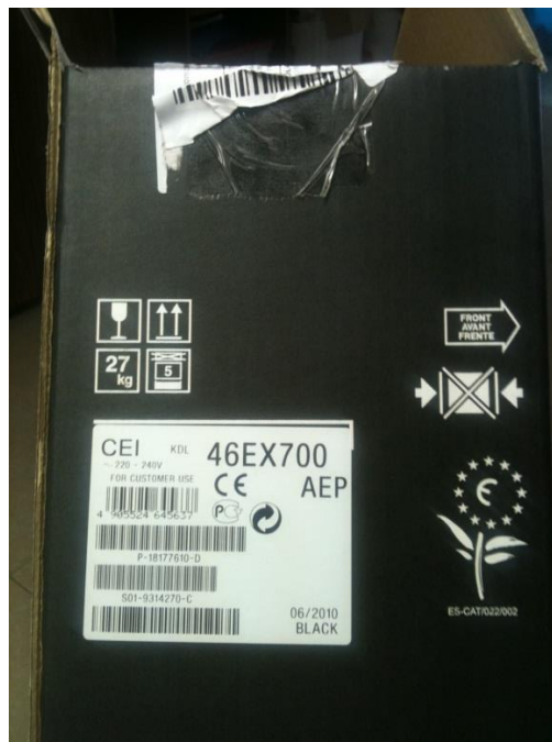
Imagen del embalaje de un televisor con etiqueta ecológica.